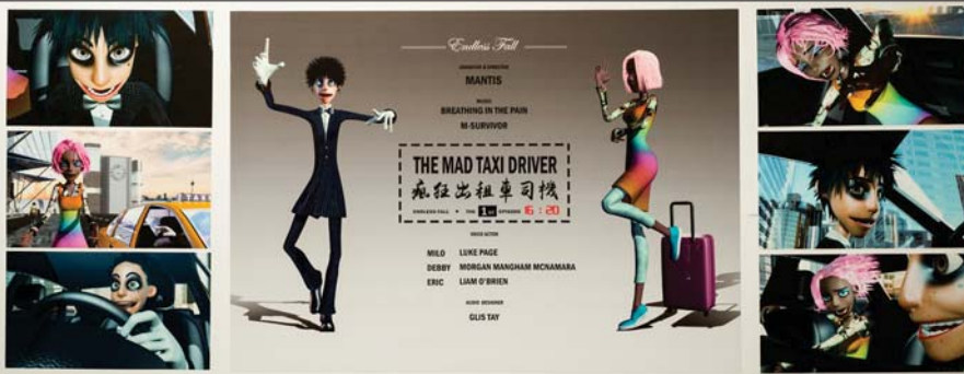
Hong Ding(Mantis) 毕业作品 "The Mad Taxi Driver" 《疯狂出租车司机》

窝在这个世界的角落里，难得清静没有任何外界干扰，每天被学校完美的软体和硬件设备包围，可以专心的做自己喜欢的事，非常开心完成了人生第一部独立3D动画片，也非常开心它争气的赢了两个奖。这充实的一年里，每一分钟都有新的东西进来。看着自己突破一个个的极限，实现了很多以前觉得不可能实现的事。总的来说，这一年是奢侈的一年。接下来，要继续朝着梦想前进了。