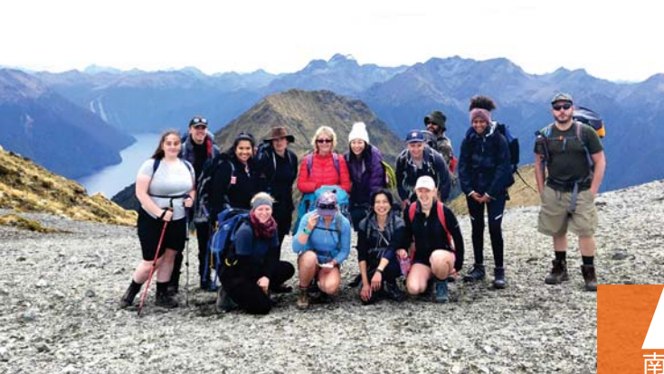
SIT环境管理学生实地考察