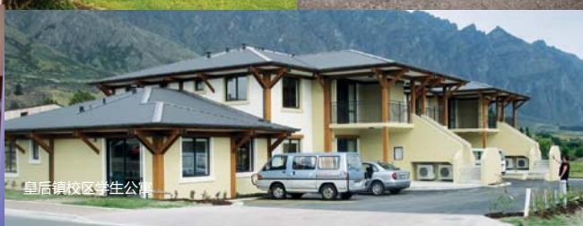
皇后镇校区学生公寓