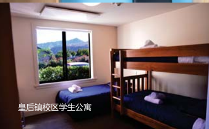
皇后镇校区学生公寓