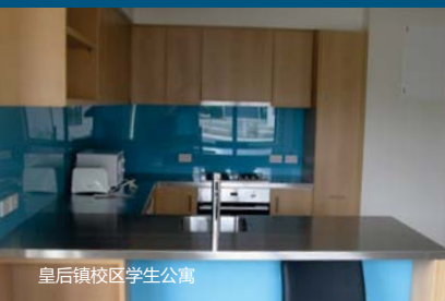
皇后镇校区学生公寓