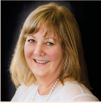
南方理工学院校长 Penny Simmonds